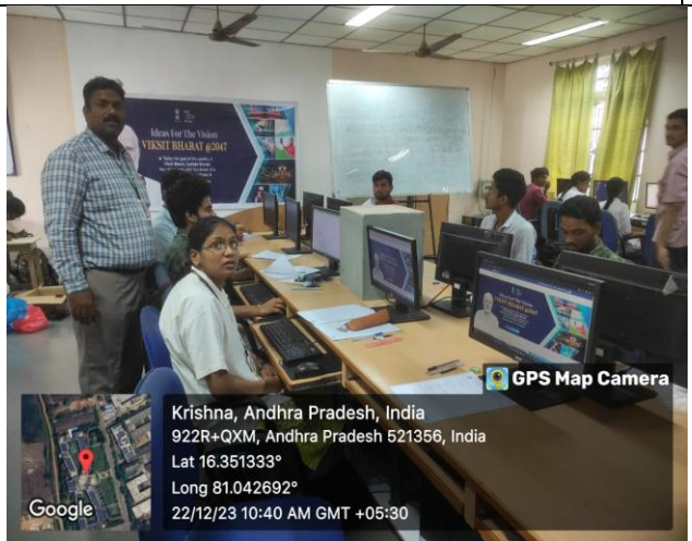
GPS Map Camera Krishna, Andhra Pradesh, India 922R+QXM, Andhra Pradesh 521356, India Lat 16.351333° Long 81.042692° 22/12/23 10:40 AM GMT +05:30