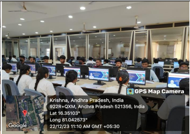
GPS Map Camera Krishna, Andhra Pradesh, India 922R+QXM, Andhra Pradesh 521356, India Lat 16.35103° Long 81.042573° 22/12/23 11:10 AM GMT +05:30