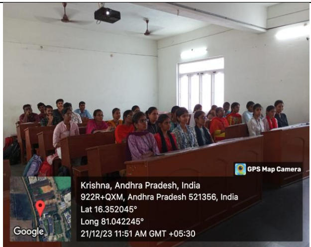
GPS Map Camera Krishna, Andhra Pradesh, India 922R+QXM, Andhra Pradesh 521356, India Lat 16.352045° Long 81.042245° 21/12/23 11:51 AM GMT +05:30