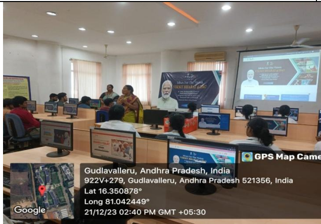
GPS Map Camera Gudlavalleru, Andhra Pradesh, India 922V+279, Gudlavalleru, Andhra Pradesh 521356, India Lat 16.350878° Long 81.042449° 21/12/23 02:40 PM GMT +05:30