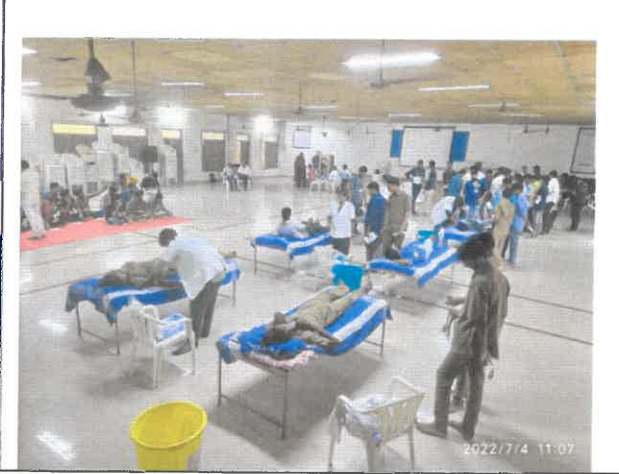
Blood Donation Camp - Gudlavalleru