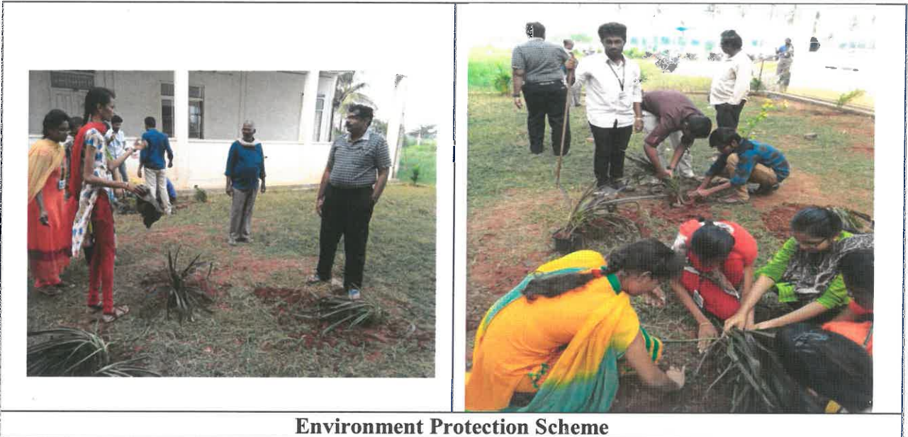
Environment Protection Scheme

Description: Plantation of trees in and around the company are meant mainly to reduce air pollution caused by factory emissions, to absorb sound, to prevent soil erosion and to maintain aesthetic value for healthy living.