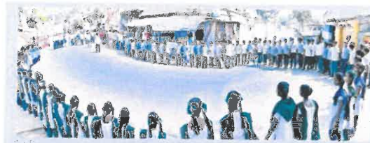
మానవహారం నిర్వహిస్తున్న ఫైన్స్కూల్ విద్యార్థులు

Description: Children's Day is celebrated across India to raise awareness about the rights, education, and welfare of children. It is celebrated on 14 November every year on the birthday of the first prime minister of India Pandit Jawaharlal Nehru, who was known to have been fond of children.