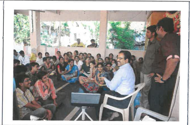
Youth Empowerment Scheme