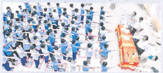
కొత్తవరం జిల్లా ఫైన్స్కూల్లో ప్రతిజ్ఞ చేస్తున్న విద్యార్థులు