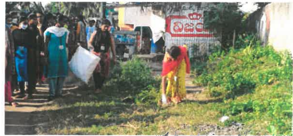
Swatch Bharath Scheme